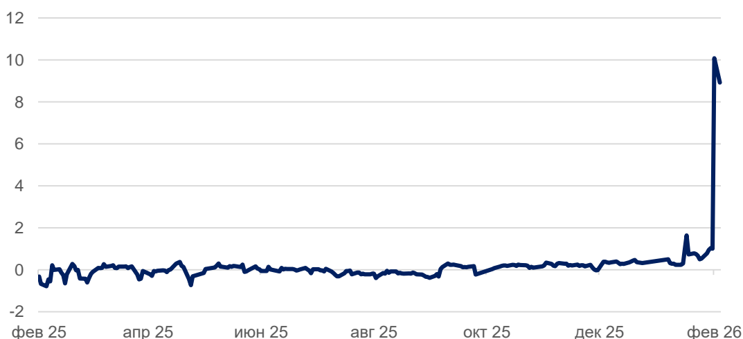
Ставки в юанях резко выросли