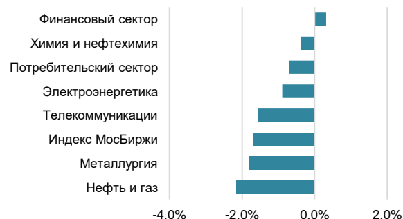
Вклад акций в Индекс МосБиржи за неделю, %